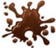
Waterig of vetzig vuil