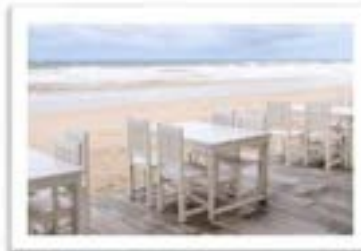
Dış mekan mobilyaları